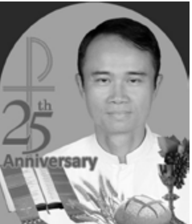
ဘုန်းတော်ကြီး စောဒေးဗစ်