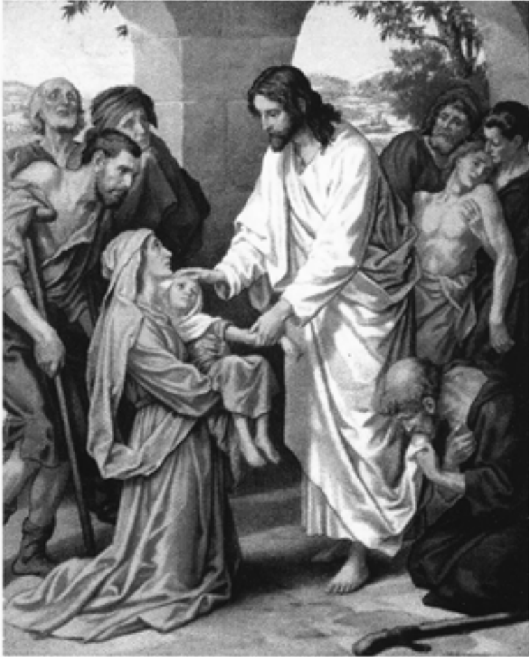
Imprimatur; + Charles Bo Yangon- Myanmar