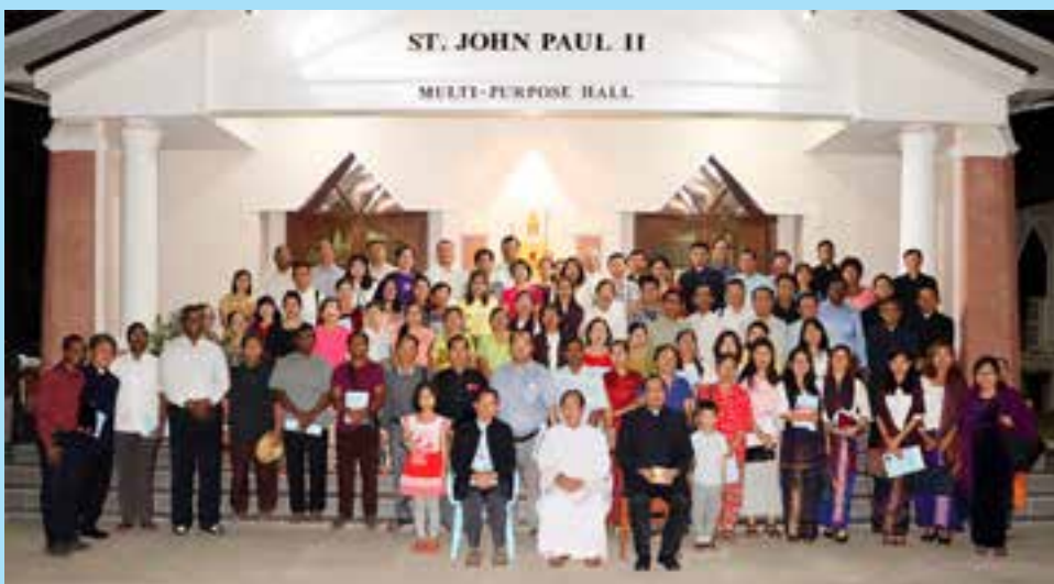
စာမျက်နှာ - ၁၃ သို့

မြန်မာနိုင်ငံလုံးဆိုင်ရာ စိန်ဂျိုးဇက်ကက်သလစ်ရဟန်းဖြစ် တက္ကသိုလ် မိသားစုအသင်း ဖွဲ့စည်းခြင်း