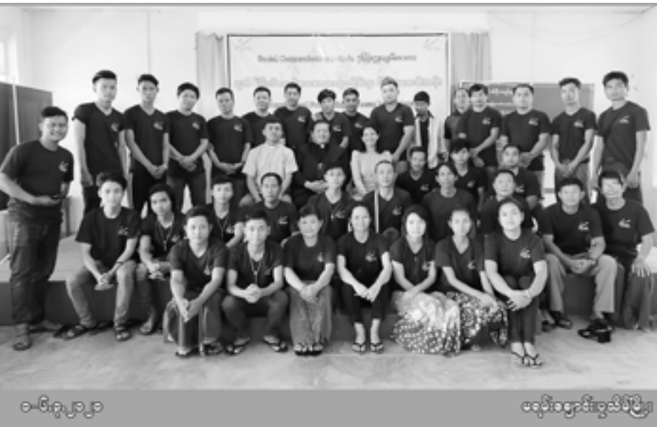
၀-၆/ရုပူ၁၃၁