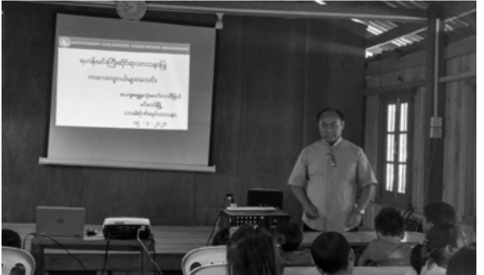
တာဝန်ရှိသူများနှင့် ဆက်လက် ဆွေးနွေးခဲ့ လည်း တက်ရောက် ခဲ့ကြသည်။ ISABELLA များ သာမက မိဘများ၊ ဓမ္မဆရာ/ဆရာမများ

ခန့်နှင့်၎င်း၊ မတ်လ ၁၅-ရက်တွင် မင်းတပ် မြို့ရွှေ နှလုံးတော်စီရင်စုမှ ကလေးသူငယ် (၁၀၀)ကျော်နှင့်၎င်း၊ မတ်လ ၁၆-ရက်တွင် ထီးလင်းမြို့ အောင်သုခကျေးရွာ ယေဇူး ဘုရင်စီရင်စုမှ ကလေးသူငယ် (၈၀) ကျော် နှင့်၎င်း တွေ့ဆုံခဲ့သည်။ CBCM-PMS ရုံး တာဝန်ရှိသူများသည် စီရင်စုအသီးသီးမှ ကလေး သူငယ်များနှင့် တွေ့ဆုံရာတွင် ရဟန်းမင်းကြီးဆိုင်ရာ သာသနာပြုအသင်း များ အကြောင်းနှင့် ရဟန်းမင်းကြီးဆိုင်ရာ သာသနာပြု ကလေးသူငယ်များ အသင်း အကြောင်းများကို ဝေမျှဖို့ချခဲ့ပြီး သာသနာ ပြု ကလေးသူငယ်များအတွက် ဆက်လက် လုပ်ဆောင်ရမည့် လုပ်ငန်းများကိုလည်း