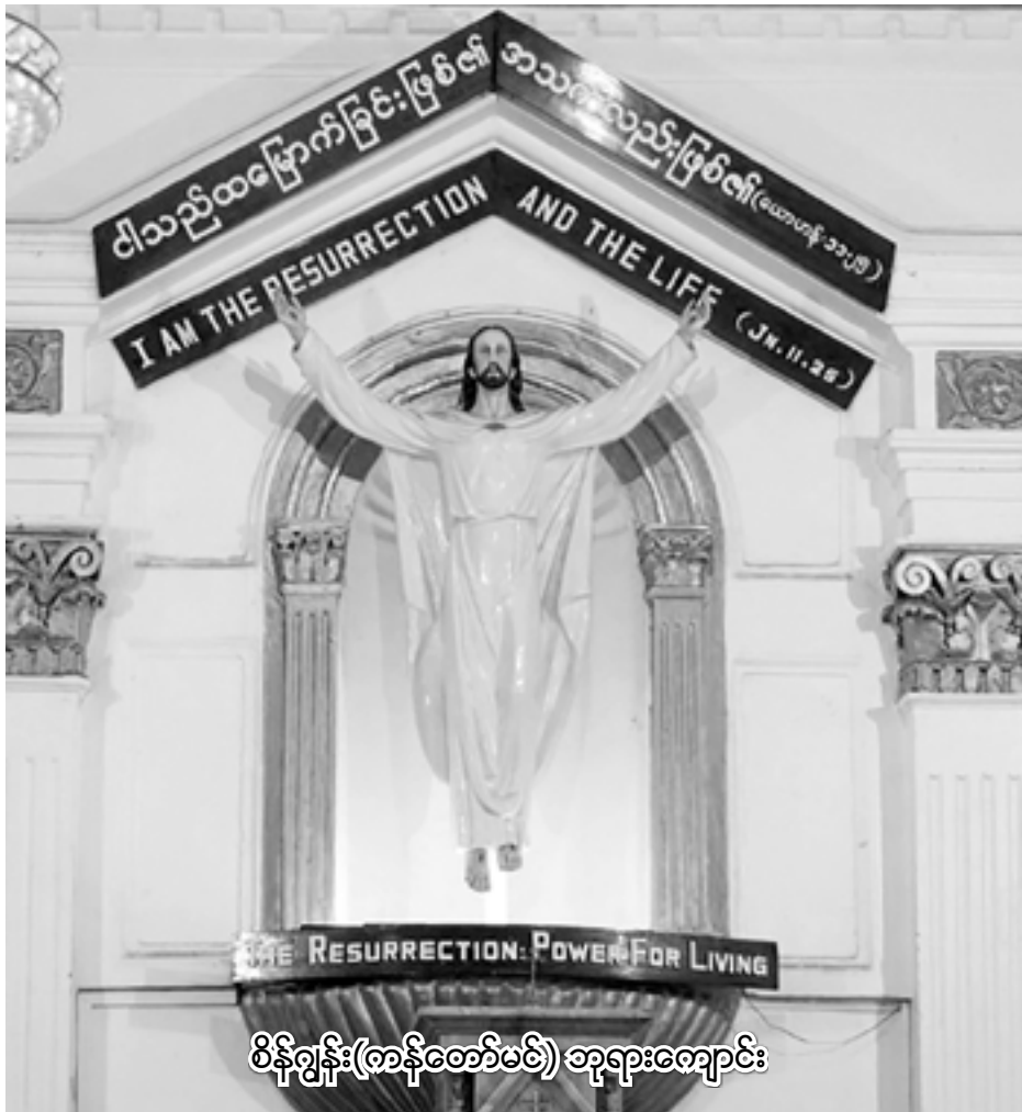
စိန်ဂျွန်း(စာနီစော်မစ်) ဆုရားကျောင်း