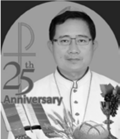
ဆရာတော် ဂျွန်စောယောဟန်