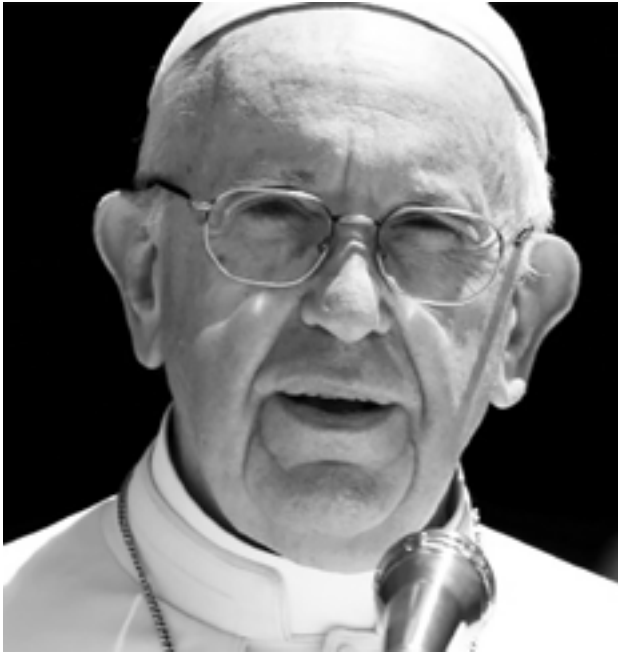
မတ်လ၊ ၁၈ ရက်၊ ၂၀၂၀

ပုပ်ရဟန်းမင်းကြီး ဖရန်စစ် အရှင်သူမြတ်က ဗုဒ္ဓဟူးနေ့ လူထုပရိတ်သတ်အား ဘုရားစကားသင်ကြားရာ တွင် မင်္ဂလာတရား (၈) ပါးထဲမှ ပဉ္စမမြောက်မင်္ဂလာဖြစ်သော "သနားကြင်နာတတ်ခြင်းရှိသော သူတို့သည် မင်္ဂလာရှိကြ၏။ အကြောင်းမူကား ထိုသူတို့သည် ကြင်နာခြင်း ခံကြရလိမ့်မည်" ဟူသော မင်္ဂလာတရားကို သွန်သင်မိန့်ကြား