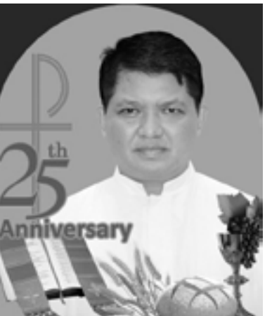
ဘုန်းတော်ကြီး မာစီအန် သက်ကျော်