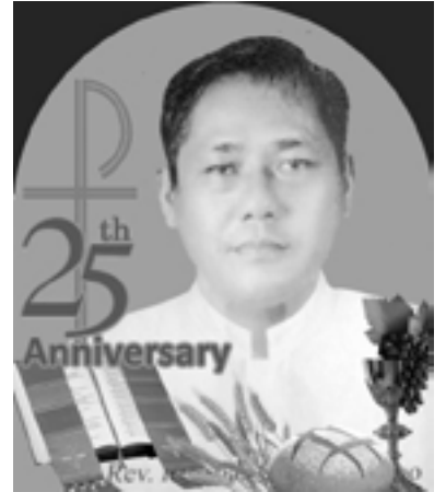
ဘုန်းတော်ကြီး ဇလိယ စောကြာထူး