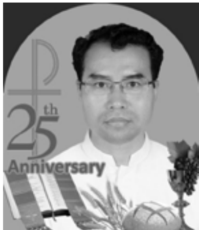
ဘုန်းတော်ကြီး စောနောဇ