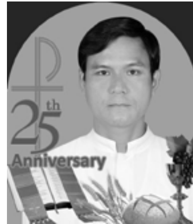
ဘုန်းတော်ကြီး ဂေးလ်ဘက် စောအယ်ဂေး